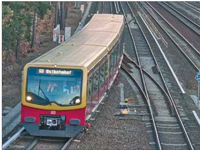
In Zukunft noch besser: Bis 2030 soll das S-Bahn-Netz modernisiert werden.

Insbesondere auf den Umlandstrecken sollen Züge häufiger fahren. Geplant ist ein 10-Minuten-Takt. Auch Pendler*innen, die die Bahn-