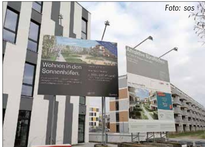
An Investoren-Gruppe verkauft: Die Sonnenhöfe in Schönefeld.

Big Deal in Schönefeld: Die Deutsche Immobilien Entwicklungs AG und Eyemaxx Real Estate haben das Wohnquartier „Sonnenhöfe“ an die Quantum Immobilien Kapitalverwaltungsgesellschaft aus Hamburg verkauft. Diese hat die Entwicklung des Quartiers im Rahmen eines so genannten Club Deals für mehrere berufsständische Versorgungswerke aus Deutschland übernommen. Zum Kaufpreis wurde nichts bekannt. Das Quartier in der Antares-, Aldebaran- sowie Angerstraße und Hans-Grade-Allee umfasst rund 54.000 Quadratmeter. Davon