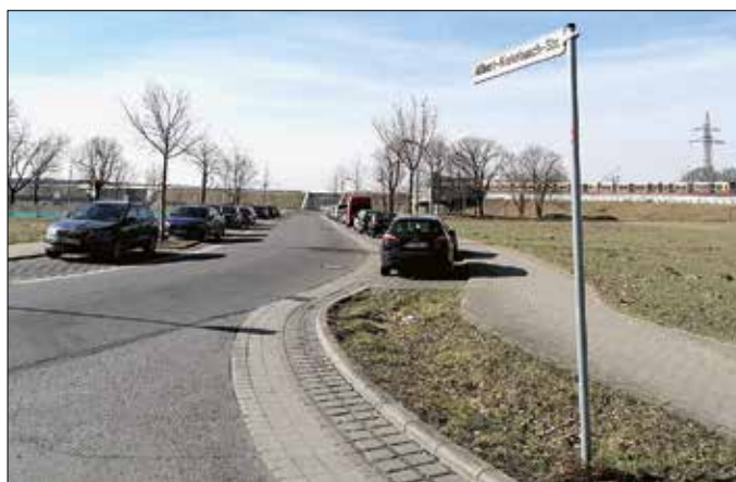
Parken mit Konzept: Die Gemeinde entwickelt Ideen für das Umfeld des neuen S-Bahn-Haltepunktes in Waßmannsdorf.

Der Parkplatz am Bahnhof umfasst rund 300 Stellplätze. Aktuell sind