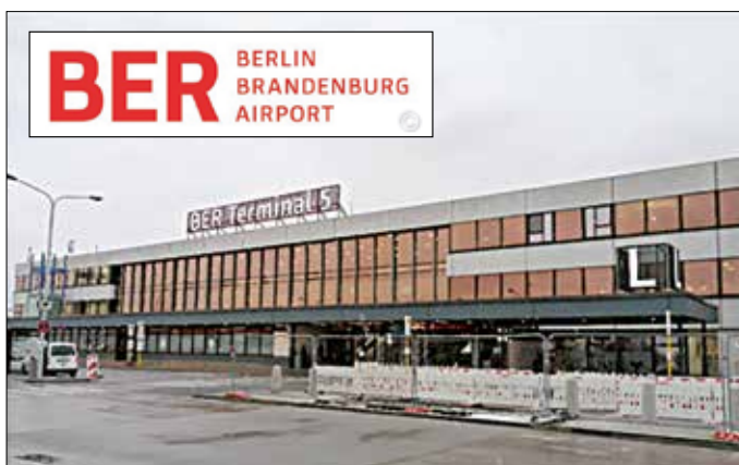
Pandemiebedingt ist der Betrieb am Terminal 5 des BER in Schönefeld vorübergehend eingestellt.

Grund für die Schließung sind die pandemiebedingt eingebrochenen Passagierzahlen und die finanzielle Notlage des Flughafens. Durch den Schlumberbetrieb des Terminal 5 könnten Kosten für Personal, Gebäudeunterhalt als auch Flugbetriebsabläufe gespart werden. Auch das neue vollständig fertiggestellte und betriebsbereite Terminal 2 wird zunächst noch nicht in Betrieb genommen. Sobald die Passagierzahlen wieder steigen, werden die Abfertigungskapazitäten der Terminals 2 und im Weiteren auch des Terminal 5 schrittweise und bedarfsgerecht einbezogen. Im Moment könne das erwartete Verkehrsaufkommen jedoch vollständig am Terminal 1 abgefertigt werden. Durch die Konzentration des Flugbetriebes an diesem Standort werde im Jahr der Schließung ein Einsparvolumen von 25 Millionen Euro avisiert.