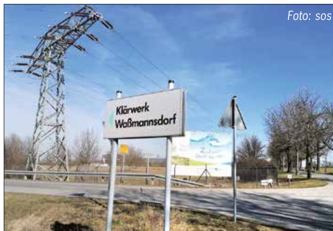
Ein Brand in Berlin löste im Klärwerk Waßmannsdorf eine Havarie aus.

In der Nacht zum 12. Februar 2021 kam es nach einem Brand in einem metallverarbeitenden Betrieb in Berlin-Marienfelde zu einer Havarie im Klärwerk Waßmannsdorf. Mit dem Löschwasser gelangten Cyanide in die Ableitbäche und führten dort in Folge biochemischer Prozesse zu teilweisem Fischsterben. Inzwischen hat sich die Biologie erholt, das Klärwerk erzielt nach Angaben eines Sprechers der Berliner Wasserbetriebe bereits seit einigen Tagen wieder die geforderten Ablaufwerte.