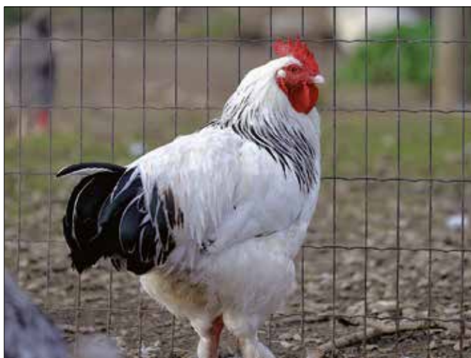
Zum Schutz vor der Vogelgrippe muss Geflügel bis auf Weitere in den Stall.

Innerhalb beider Zonen ist das Geflügel aufzustellen. Sofern noch