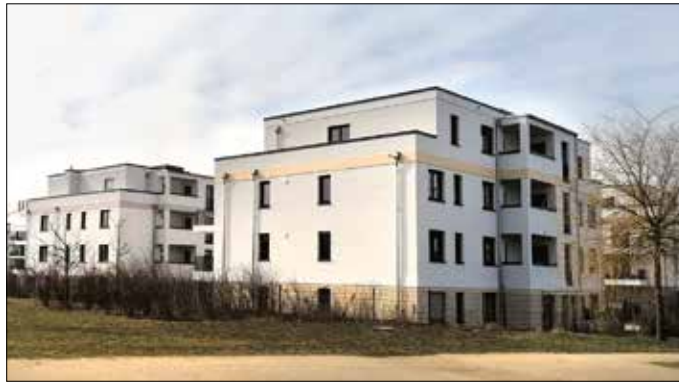
Bauboom in Schönfeld: Doch wie entwickeln sich die Mieten? Nachdem in der Gemeinde keine Mietpreisbremse mehr gilt, eine offene Frage.

In seiner Antwort, die den Gemeindevertretern in der jüngsten Sitzung Mitte März zugegangen ist, verwies dieser auf ein Verfahren, das bereits vor seiner Amtszeit vom Infrastrukturministerium in die Wege geleitet worden war. Danach sei die Gemeinde im Oktober 2019 um Teilnahme an einer Befragung zur Erstellung eines Gutachtens für die Evaluierung von Kappungsgrenze und Mietpreisbremse gebeten worden. Die Gemeinde Schönfeld hätte daraufhin im November des Jahres mitgeteilt, dass sie zwar in jeder Hinsicht eine wachsende Gemeinde sei, aber keine Aussage zu den Auswirkungen und dem Erfordernis einer Mietpreisbremse oder Kappungsgrenze machen könne. Die Gemeinde füllte den Fragebogen nicht aus und erteilte eine Fehlermeldung.