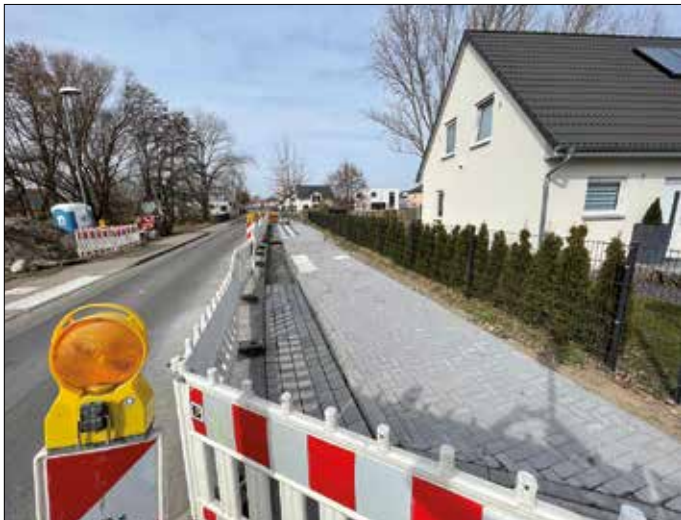
Die Bushaltestelle im Karlshofer Weg ist fast fertig. Mit der Überdachung wird es allerdings noch etwas dauern.

Bereits im letzten Jahr wurde mit den Erdarbeiten für die lang ersehnte Überdachung der Haltestelle begonnen.