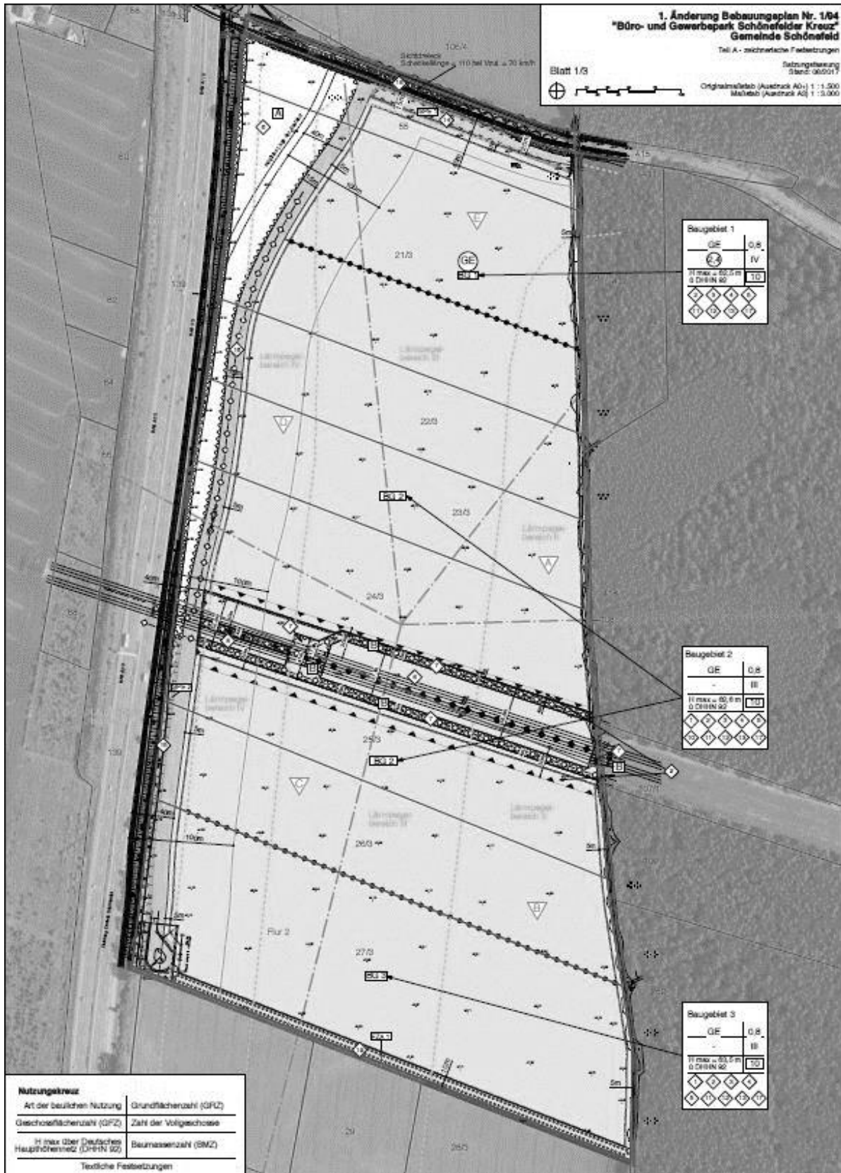
Abb. Abgrenzung des Geltungsbereiches