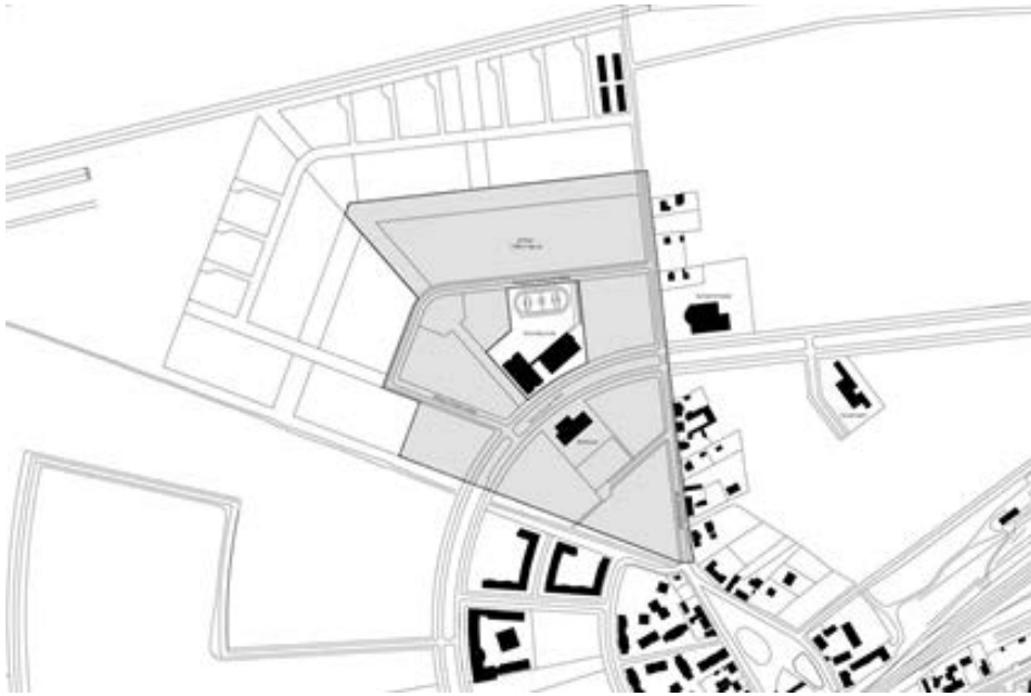
Abb. Geltungsbereich des Bebauungsplanes

Die formelle Beteiligung der Bürger nach § 3 Abs.2 BauGB findet im Rahmen einer öffentlichen Auslegung in der Zeit