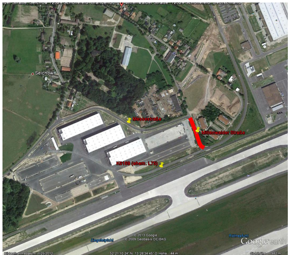
Lageplan mit Darstellung des Einziehungsbereichs █